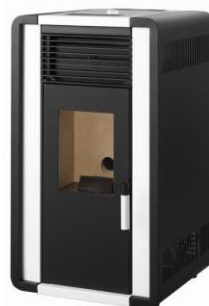
i) e iiiii)