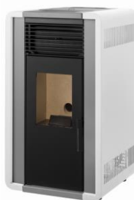
i) e iiiii)